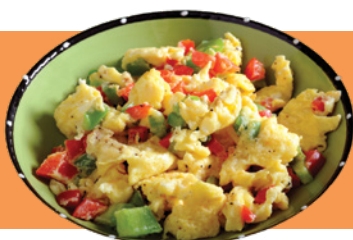
Huevos revueltos con verduras de la cena anterior