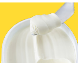
Queso crema bajo en grasa