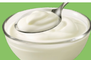
Yogur bajo en grasa o sin grasa