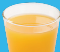
Taza pequeña de jugo de fruta 100% natural